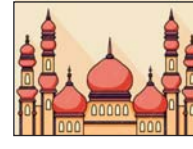
মুহাররম সম্পর্কে সংক্ষিপ্ত আলোচনা দাওয়াত