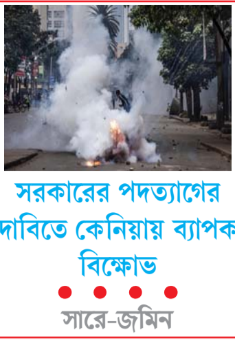
সরকারের পদত্যাগের দাবিতে কেনিয়ায় ব্যাপক বিক্ষোভ সার-জমিন