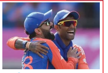
পাণ্ডিয়া নন, ভারতের নতুন অধিনায়ক হতে যাচ্ছেন সূর্যকুমার খেলতে খেলতে