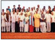
বিধানসভা উপনির্বাচনে ইন্ডিয়া জোটের ফলাফলের তাৎপর্য সম্পাদকীয়