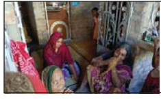
চেন্নাইয়ে মৃত্যু জলঙ্গির পরিযায়ী শ্রমিকের রূপসী বাংলা