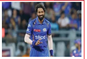
আমার অধিনায়কত্ব সরল-সিধে: পাণ্ডিয়া খেলতে খেলতে