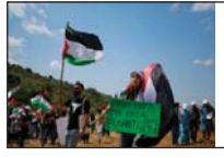
বিশ্বকে যে কারণে দ্বিতীয় 'বিপর্ষয়' ঠেকাতেই হবে সম্পাদকীয়