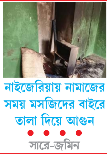
নাইজেরিয়ায় নামাজের সময় মসজিদের বাইরে তলা দিয়ে আগুন সারে-জমিন