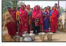
পানীয় জলের সংকট, রাস্তা অবরোধ করে বিক্ষোভ রূপসী বাংলা