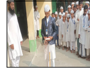
দ্বিতীয় শ্রেণির মাদ্রাসা ছাত্র তৈরি করল বিমান! সাধারণ