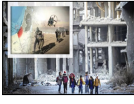
মধ্যপ্রাচ্যের রাজনীতি: ২০২৫ সাল কেমন যাবে? সম্পাদকীয়