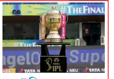
আইপিএল শুরু ২১ মার্চ, উদ্বোধন ও ফাইনাল ইডেনে খেলেতে খেলেতে