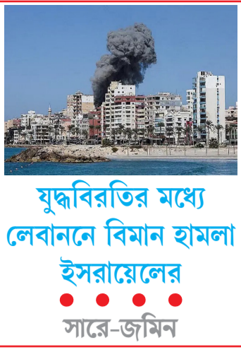
যুদ্ধবিরতির মধ্যে লেবাননে বিমান হামলা ইসরায়েলের সারে-জমিন